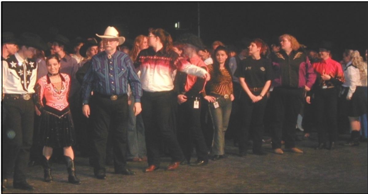
Kjente fjes fra SWC og andre klubber under fellesmønstringen før konkurransen.