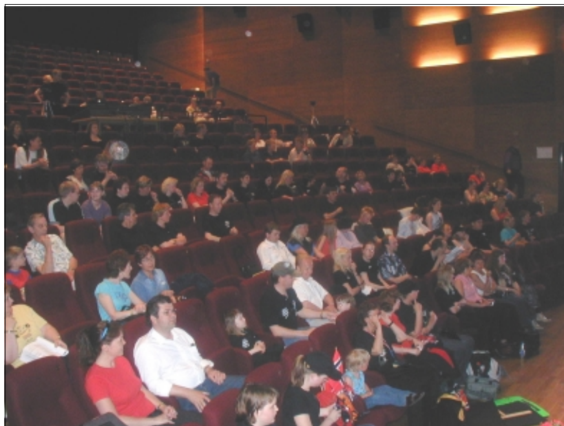
Salen var fremragende, alle så like godt uansett hvor de satt.