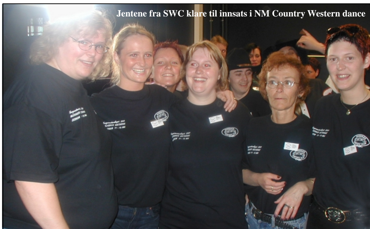
Jentene fra SWC klare til innsats i NM Country Western dance