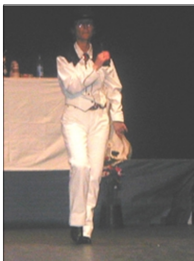
Else i aksjon.